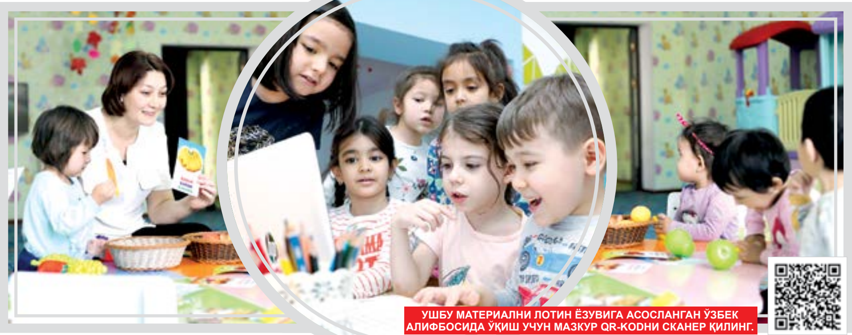
УШБУ МАТЕРИАЛНИ ЛОТИН ЁЗУВИГА АСОСЛАНГАН ЎЗБЕК АЛИФБОСИДА УҚИШ УЧУН МАЗКУР QR-КОДНИ СКАНЕР ҚИЛИНГ.

Тасаввур қилинг: оstonадан майда қадам ташлаб кириб келаётган фарзандингизнинг "Ойи, бугун мен беш баҳо олдим", деган хурсанд кийкириги сизни қанчалар қувонтиради. Уйингиз кўржи бўлмиш фарзандингизнинг ҳар бир ютуғи кўксингизни тоғдек кўтарари. Зеро, ота-она учун фарзанд камолини кўришдан ортиқроқ бахт йўқ. Ҳа, мактабга таълим