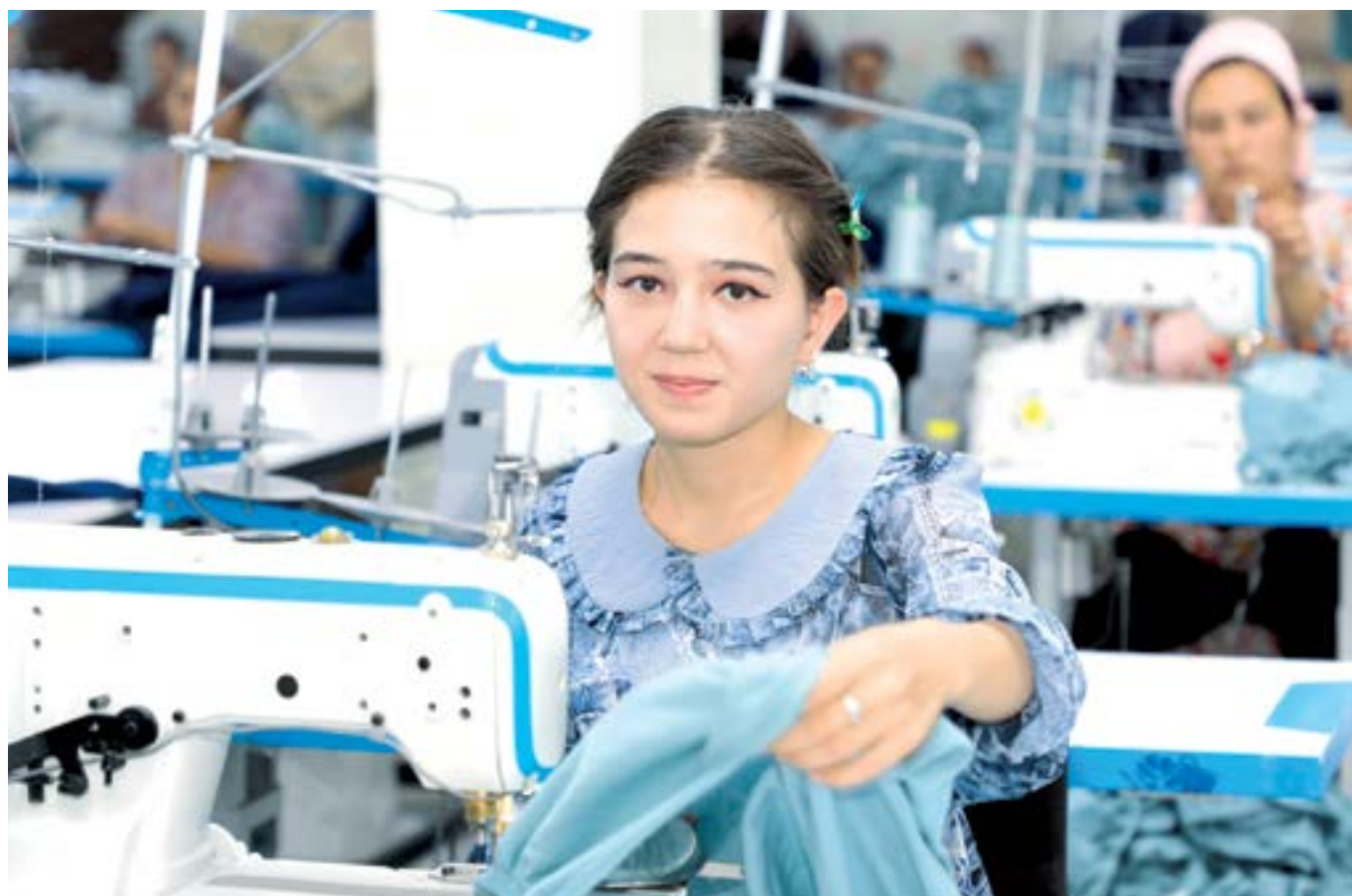
▶ Давоми 3-бетда

Кредит ва ер ажратиш, солиқ, транспорт логистикаси, экспорт, зарур инфраструктура — булар кичик бизнес ва хусусий тадбиркорликни ривожлантиришга хизмат қилувчи энг муҳим омиллар. Шу билан бирга, соҳа вакиллари кийнайдиган масалалар ҳам шу йўналишларга дахлдор. Айнан шу нуқтаи назардан, давлатимиз раҳбарининг тадбиркорлар билан юзма-юз, самимий суҳбатлашиши, фикр алмашиши, улар фаолиятидаги муаммо ва камчиликларга шахсан қизиқиб, ечим топиб бераётгани жуда эътиборга молик жиҳатдир.