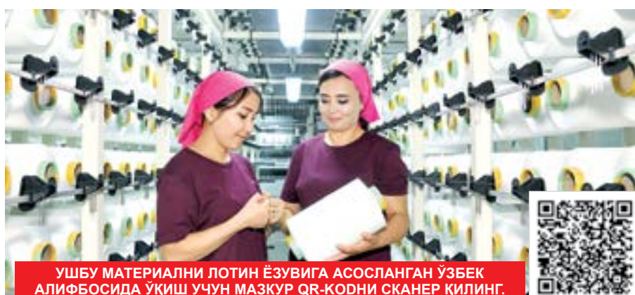
УШБУ МАТЕРИАЛНИ ЛОТИН ЁЗУВИГА АСОСЛАНГАН ЎЗБЕК АЛИФБОСИДА ўқиш учун МАЗКУР QR-КОДНИ СКАНЕР ҚИЛИНГ.

Бундай янгиланишлар, табиийки, соҳа вакиллари фаолиятига ижобий таъсир кўрсатади. Уларни турли кераксиз қозғозбозлик ва оворагарчиликлардан ҳимоя қилади. Ҳимояни ҳис қилган ишбилармон эса истиқболга катта ишонч билан янги лойиҳаларни амалга ошириш ҳаракатида бўлади.