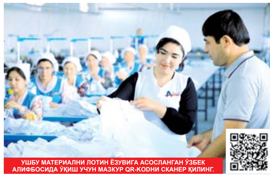
УШБУ МАТЕРИАЛНИ ЛОТИН ЁЗУВИГА АСОСЛАНГАН ЎЗБЕК АЛИФБОСИДА ўқиш учун МАЗКУР QR-КОДНИ СКАНЕР ҚИЛИНГ.

Маъмурий жавобгарлик тўғрисидаги кодексга киритилган янги моддага кўра, тадбиркорлик субъектлари банк ҳисобварақларидан пул маблағларини уларнинг розилигисиз қонунга хилоф равишда ўтказиш ёки олиб қўйиш ёхуд ортиқча ундирилган пул