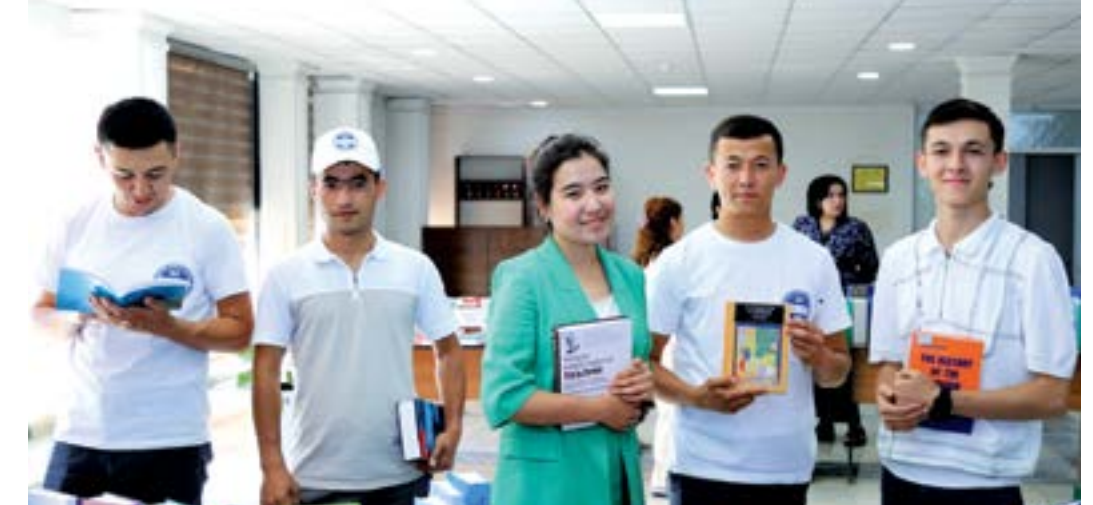
УШБУ МАТЕРИАЛНИ ЛОТИН ЁЗУВИГА АСОСЛАНГАН ЎЗБЕК АЛИФБОСИДА УҚИШ УЧУН МАЗКУР QR-КОДНИ СКАНЕР ҚИЛИНГ.

Халқимиз ижтимоий тараққийта интилиши ва чўқур маънавий салоҳияти билан янги Ўзбекистонни барпо этмоқда. Замонавий шароитда мамлакатимизда жамият ва инсон фаровонлиги, ижтимоий-маънавий тақомиллини таъминлаш борасида муҳим, ўз навбатида, юксак марра қўйилиб, ёруғ истиқболни кўзлаган чора-тадбирлар олиб борилмоқда. Узани ўзи ривожлантиришга қодир шахсни шакллантириш, бугун олаётган ҳар нафасини шу эл, шу халқ тинчлиги, давлат тараққийти учун сафарбар қилиш, умуман, кечаги натижа, кечаги қараш ва мезонлар бугун тарихга айланди, деб ҳисоблашни докор. Шу вақтга қадар эришган ҳар қандай марраларимиз бизни қониқтирмаслиги ҳамда мана шу уй-фикрларимизни миллий феноменга айлантормоғи миз давр талабидир.