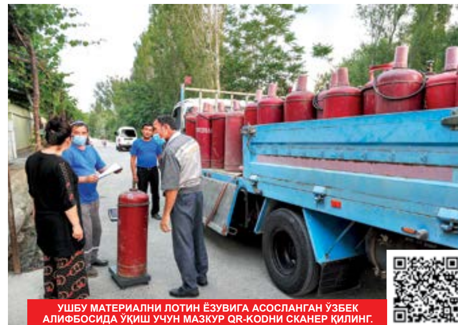
УШБУ МАТЕРИАЛНИ ЛОТИН ЁЗУВИГА АСОСЛАНГАН ЎЗБЕК АЛИФОСИДА УҚИШ УЧУН МАЪҚУР QR-КОДИ СКАНЕР ҚИЛИНГ.

Шу билан бирга, маҳалла раисларининг халқ олдидagi масъулияти ва жавобгарлиги аниқ белгиланади. Одамларнинг ишончини қозонмаган маҳалла