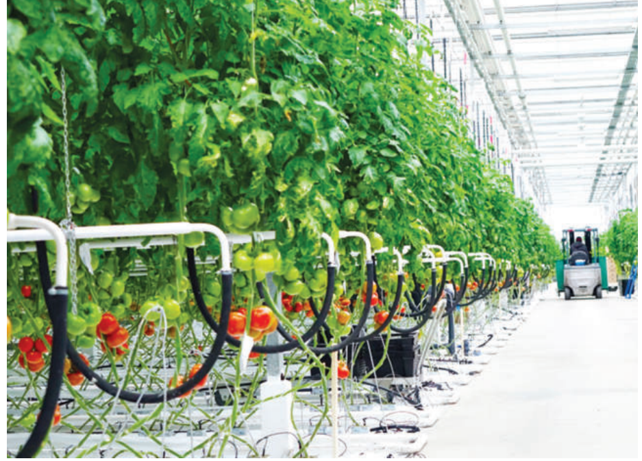
Jahon tabiiy resurslar instituti (World Resources Institute) va Buyuk Britaniyaning "Economist Intelligence Unit" tashkiloti

loti tadqiqotlariga ko'ra, 2040-yilga borib, suv tanqisligiga eng ko'p uchrashi taxmin qilinayotgan 33 davlat orasida Markaziy Osiyo mamlakatlari, xususan, O'zbekiston ham bor. Mutaxassislar fikricha, 2050-yilgacha suv resurslari yurtimizning asosiy suv manbai hisoblangan Sirdaryo havzasida 5 foizgacha, Amudaryo havzasida esa 15 foizgacha kamayishi mumkin. Demak, bularning barchasi yuqorida qayd etib o'tganimizdek, yil sayin qurg'oqchilik kuchayib, suv tanqisligi muammosi ortib